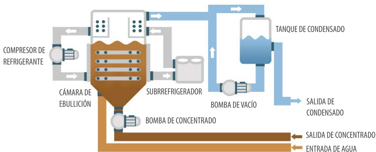
DIAGRAMA DE PROCESO